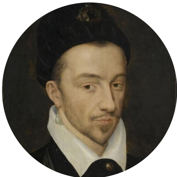
Clément Janequin (ca.1495 – ca.1560)

He was a French composer, author, musician, creator, performer, arranger, and translator of the Renaissance, he is considered to be one of the most famous composers of French song or chanson and is often described as one of the great masters of polyphonic song and programmatic music; his fame is credited to the development of printing and music publishing. (6,7,8,9,10,12)